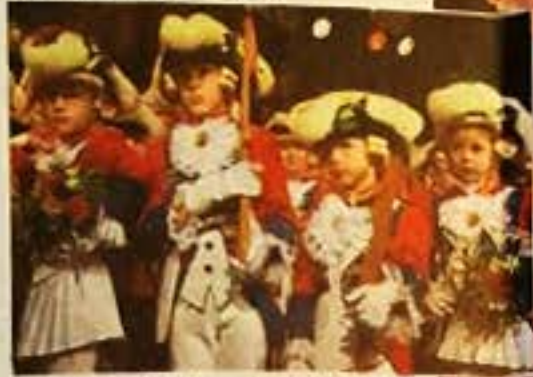
Die Pänz der Beueler Stadtsoldaten durften nicht fehlen.

Hin und weg war die Präsidentin vom erstmaligen Auftritt der Trommler-Truppe Fascinating Drums : „Wenn die auf der Bühne sind fliegen die Stö-